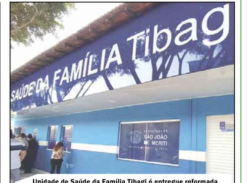
Unidade de Saúde da Família Tibagi é entregue reformada

PSF da Rua Tibagi e compra de ônibus adaptado para crianças com deficiência que estudam