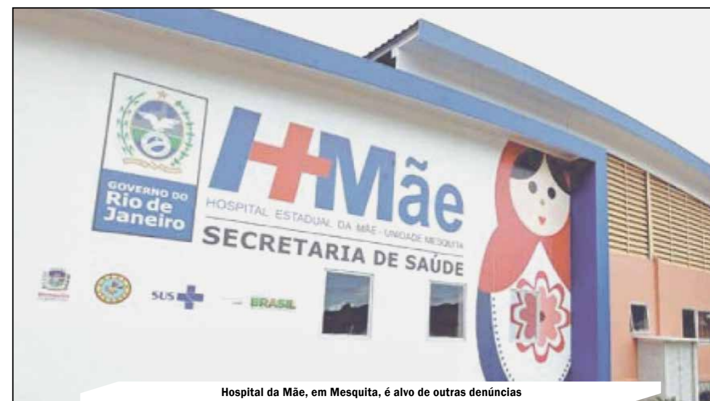
Hospital da Mãe, em Mesquita, é alvo de outras denúncias