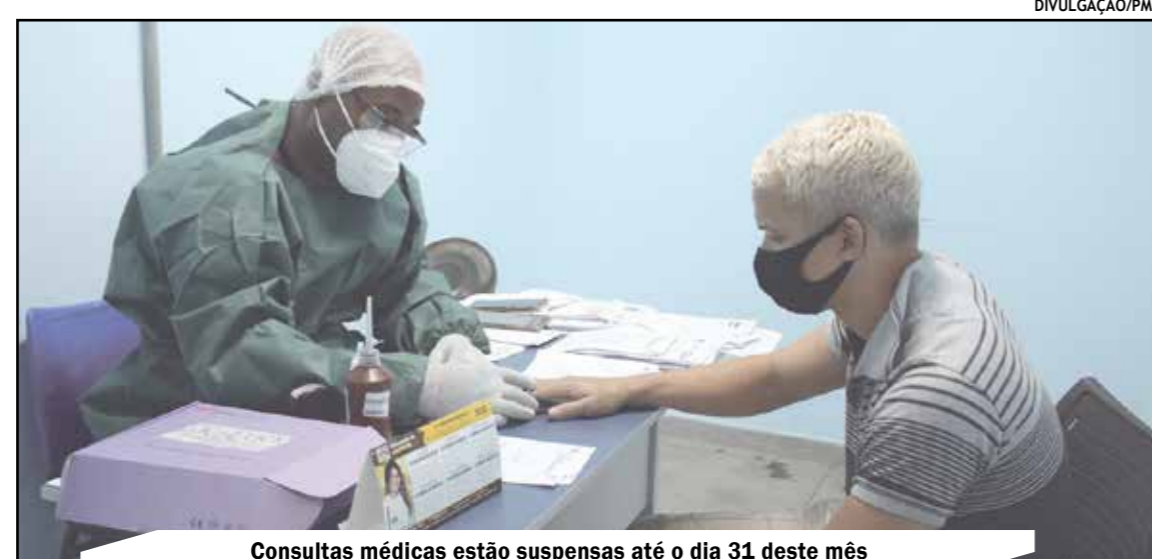
Consultas médicas estão suspensas até o dia 31 deste mês

O documento determina a suspensão do atendimento presencial ao público nos órgãos da administração pública mu-