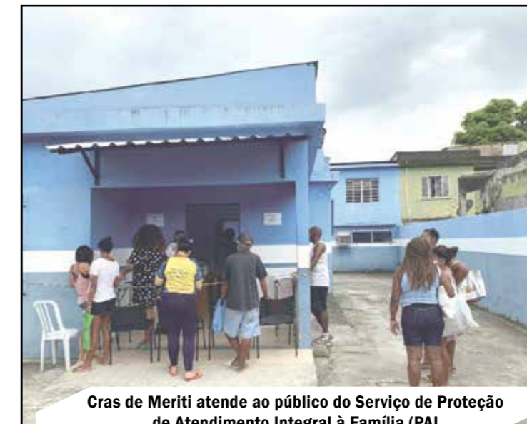
Cras de Meriti atende ao público do Serviço de Proteção de Atendimento Integral à Família (PAI)

brou que em anos anteriores já contribuiu com liberação de emendas para reforma do