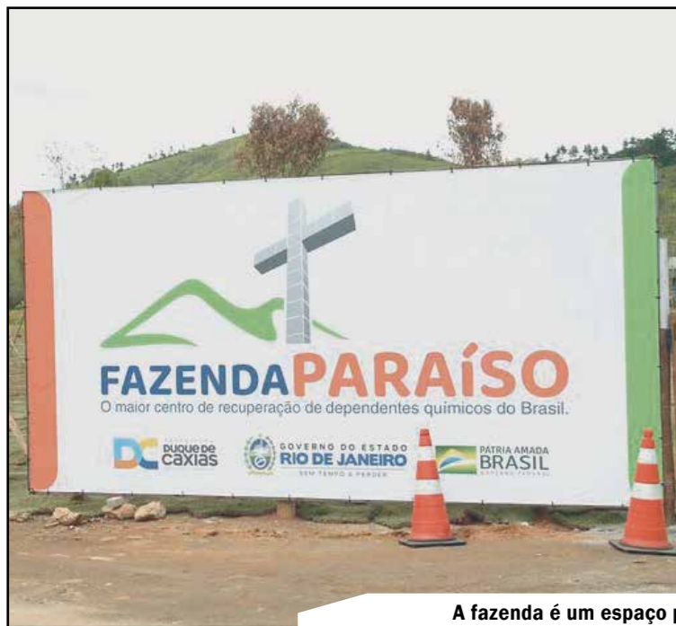
A fazenda é um espaço para ocupar a mente do dependente e ele se recuperar do vício das drogas

Projeto é inspirado em modelos de sucesso no Brasil e no exterior