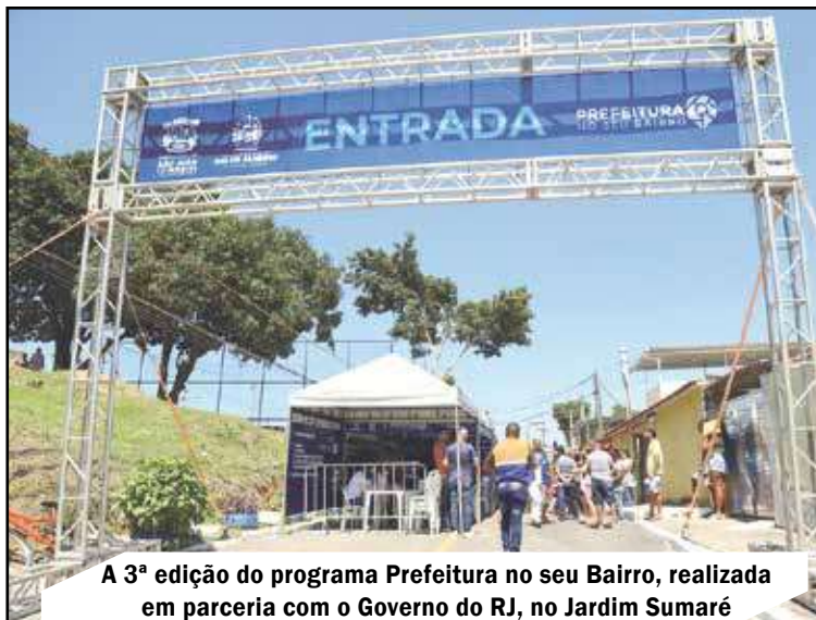
A 3ª edição do programa Prefeitura no seu Bairro, realizada em parceria com o Governo do RJ, no Jardim Sumaré

A entrega do certificado aconteceu no dia 23 de outubro durante a terceira edição do programa Prefeitura no seu Bairro, realizada em parceria com o Governo do Estado, no Morro Azul, Jardim Sumaré. A ação oferece diversos serviços à comunidade e conta com a participação das secretarias municipais de Ambiente e Sustentabilidade (com Bem-Estar Animal), Assistência Social, Casa Civil, Cultura e Direitos Humanos, Defesa Civil, Educação, Esporte e Lazer, Fazenda, Indústria e Comércio, Obras, Planeja-