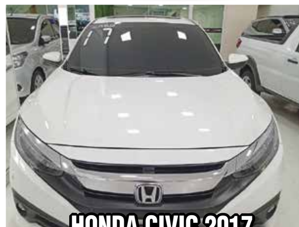
HONDA CIVIC 2017