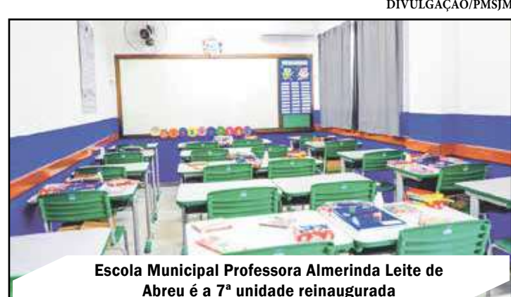
Escola Municipal Professora Almerinda Leite de Abreu é a 7ª unidade reinaugurada

Esta é a sétima escola municipal a ser reinaugurada neste novo mandato. A Escola Municipal Professora Almerin-