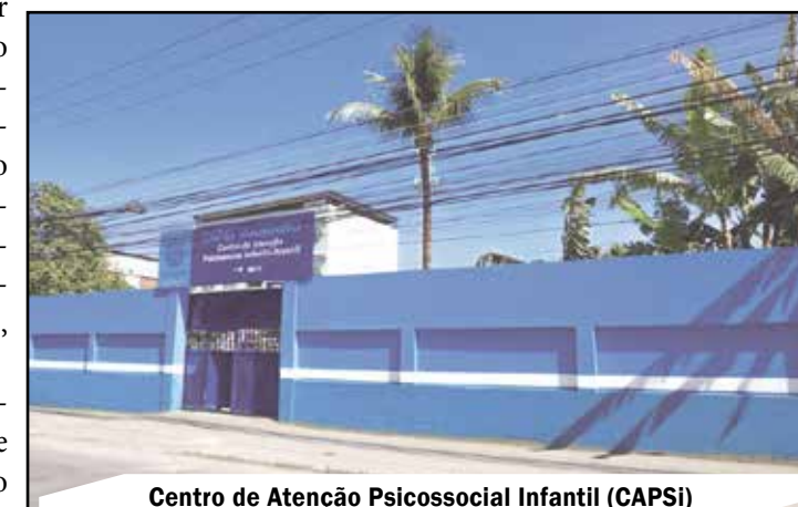
Centro de Atenção Psicossocial Infantil (CAPSi)

No bairro Trezentos, entregou mais uma unidade escolar. A E. M. Antônio Guedes, que foi totalmente revitalizada. “Hoje é mais um dia especial, pois estamos reinaugurando mais uma unidade escolar totalmente revitalizada, que é a quarta dentro de uma comunidade. A presença do governador do Estado nos demonstra o quanto nosso prefeito valoriza a educação. Aproveito para