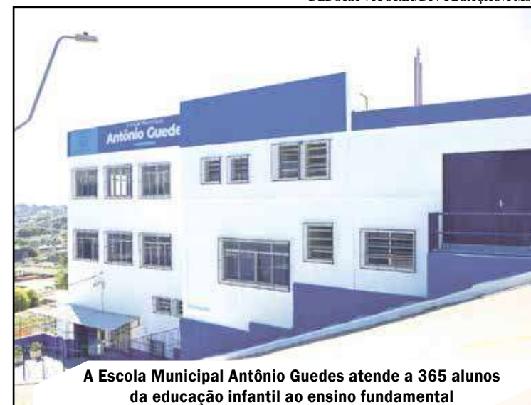
A Escola Municipal Antônio Guedes atende a 365 alunos da educação infantil ao ensino fundamental