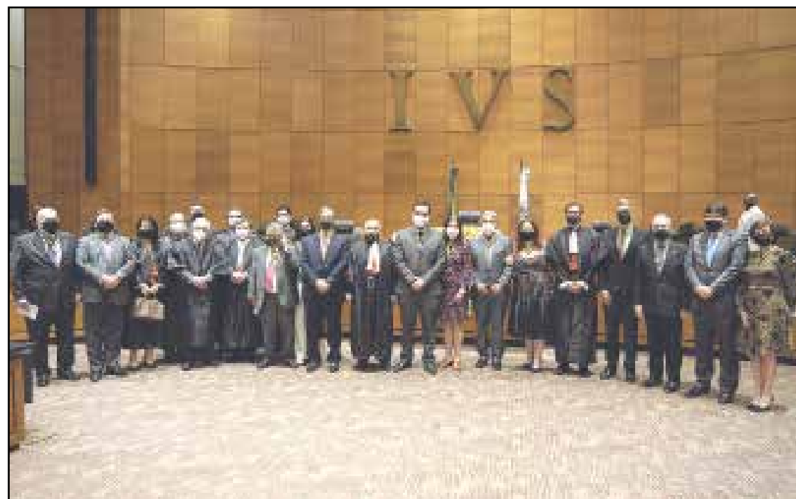
dação da democracia brasileira. como defensora da democracia, atuando de maneira séria, limpa e célere", discursou.

O presidente da Assembleia Legislativa do Estado do Rio de Janeiro (Alerj), André Ceciliano (PT), foi um dos 19 homenageados pelo Tribunal Regional Eleitoral (TRE-RJ) com a Medalha do Mérito Eleitoral, entregue na última segunda-feira em solenidade realizada no Tribunal de Justiça do Estado (TJ-RJ).