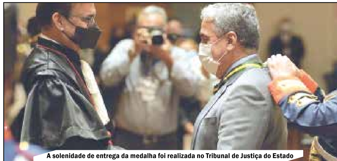
A solenidade de entrega da medalha foi realizada no Tribunal de Justiça do Estado