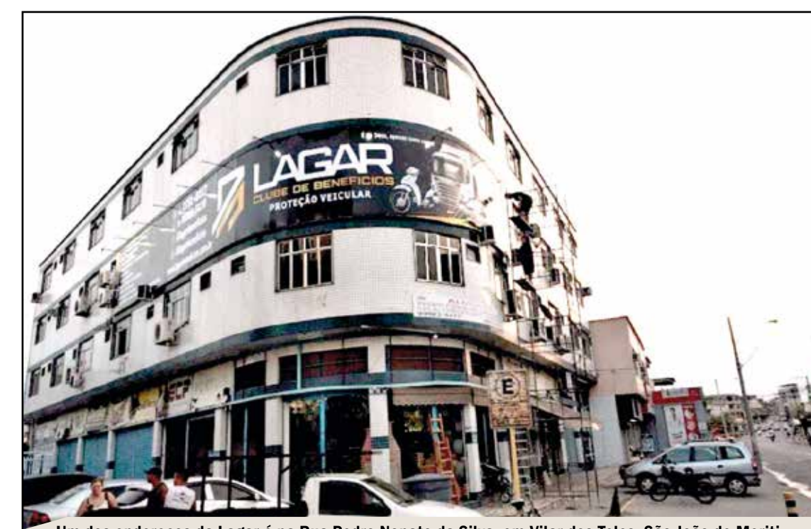
Um dos endereços da Lagar é na Rua Pedro Nonato da Silva, em Vilar dos Teles, São João de Meriti

A LAGAR preza pela transparência, qualidade nos serviços e um atendimento eficiente e de referência que resulta na satisfação do cliente.