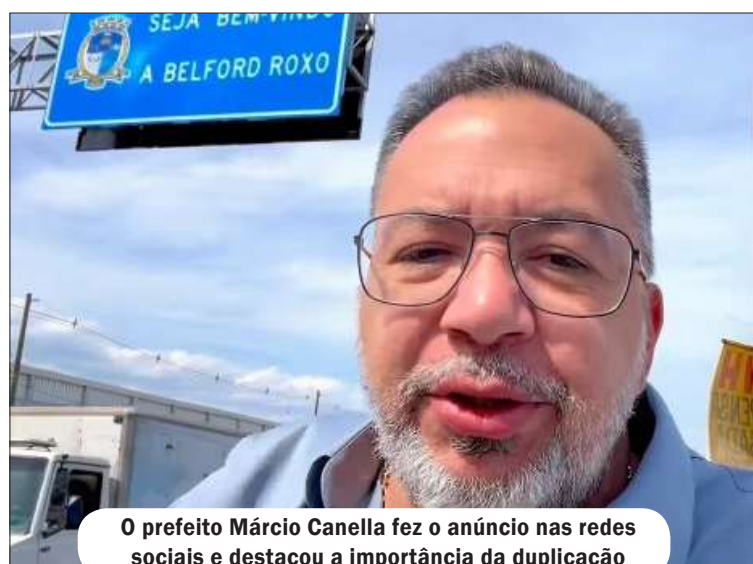
O prefeito Márcio Canella fez o anúncio nas redes sociais e destacou a importância da duplicação

O prefeito Márcio Canella, ao lado do governador Cláudio Castro, do secretário de Estado das Cidades, Douglas Ruas e do presidente Nacional do União Brasil, Antonio Rueda, darão a ordem de início da obra de duplicação do Viaduto de Belford Roxo no dia 15 de dezembro, que liga o município, a partir do bairro Guaciacaba à cidade de Mesquita (Avenida Coelho da Rocha/BNH), sobre a Rodovia Presidente Dutra.