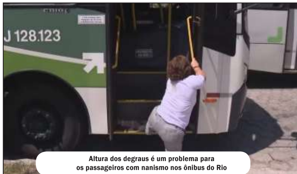
Altura dos degraus é um problema para os passageiros com nanismo nos ônibus do Rio

outras pessoas aproximarem do validador.