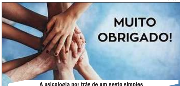
A psicologia por trás de um gesto simples

As pessoas que habitualmente agradecem aos motoristas com a mão tendem a ter uma visão mais positiva da vida e, consequentemente, desfrutam de uma existência mais satisfatória. A frequência desses atos públicos de gratidão fortalece as conexões interpessoais, mesmo entre estranhos. Este ato é um claro exemplo