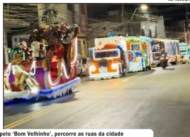
Coberta de luzes coloridas, a Caravana de Natal da Família Aquino, comandada pelo 'Bom Velhinho', percorre as ruas da cidade