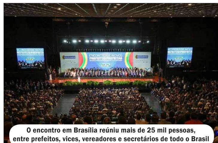
O encontro em Brasília reuniu mais de 25 mil pessoas, entre prefeitos, vices, vereadores e secretários de todo o Brasil

“Os números mostram a credibilidade do governo para com os municípios. Independentemente de partido ou posição ideológica, a adesão foi extraor-