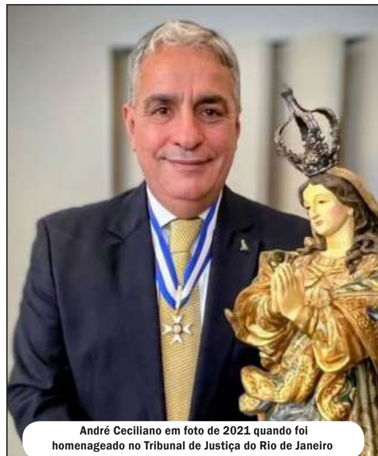
André Ceciliano em foto de 2021 quando foi homenageado no Tribunal de Justiça do Rio de Janeiro

No dia 8 de dezembro de 2021, Ceciliano, então presidente da Assembleia Legislativa do Estado do Rio de Janeiro (Alerj), foi um dos 29 homenageados com o Colar do Mérito Judiciário durante solenidade realizada no Tribunal de Justiça do Estado do Rio de Janeiro (TJ-RJ). A honraria foi concedida a personalidades que, direta ou indiretamente, prestaram