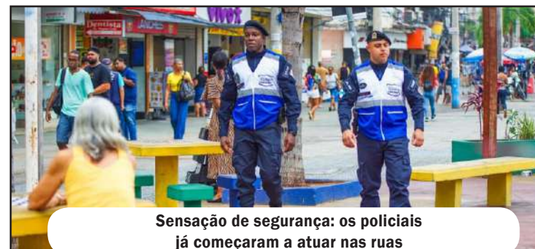
Sensação de segurança: os policiais já começaram a atuar nas ruas

A base atuará diariamente no Centro de São João de