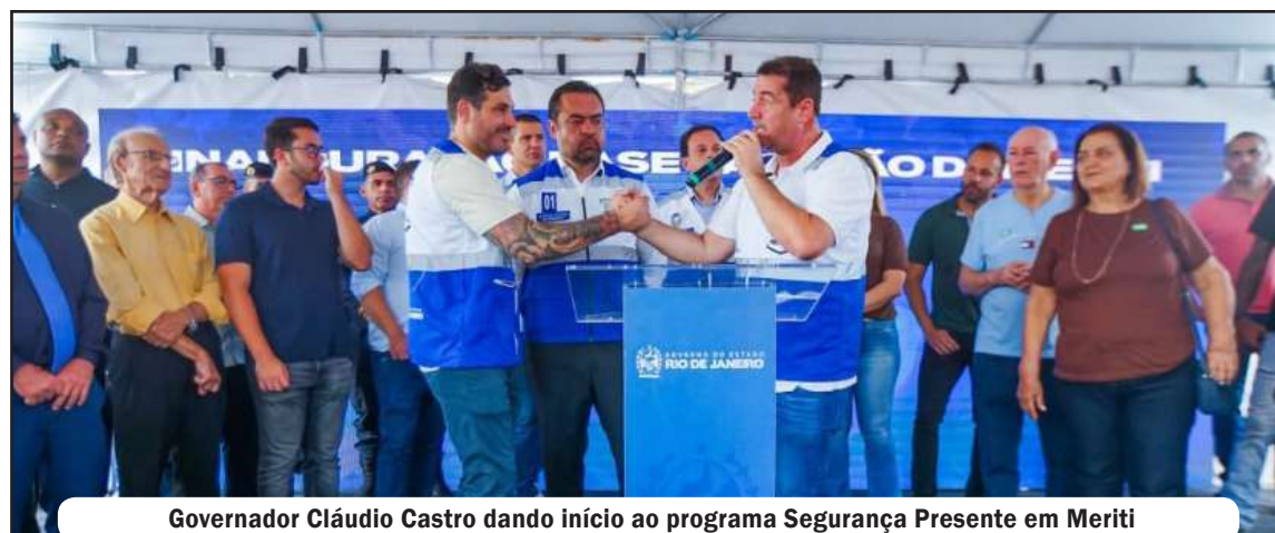
Governador Cláudio Castro dando início ao programa Segurança Presente em Meriti