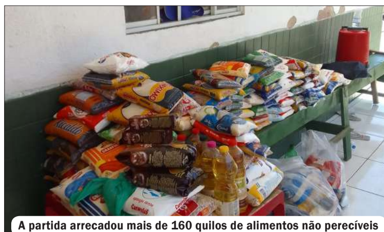
A partida arrecadou mais de 160 quilos de alimentos não perecíveis

O jogo beneficente entre amigos, que foi realizado na manhã do dia 30 de novembro, no Campo do Zé Macaco, no bairro Andrade de Araújo, reuniu as equipes do Amigos do Vasco e Amigos do Flamengo para arrecadação de alimentos. O placar da partida foi 2 (Flamengo) a 0 (Vasco), mas o verdadeiro campeão foi o espírito solidário dos atletas e dos torcedores que marcaram presença para prestigiar o evento.