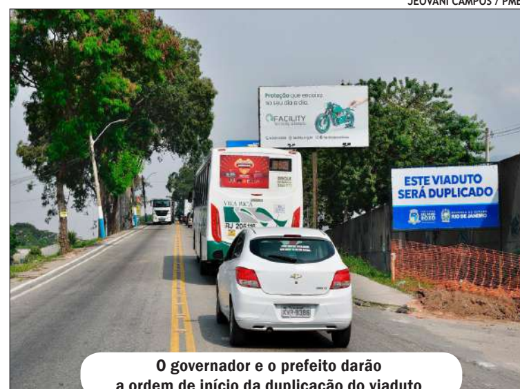
O governador e o prefeito darão a ordem de início da duplicação do viaduto