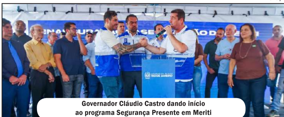
Governador Cláudio Castro dando início ao programa Segurança Presente em Meriti