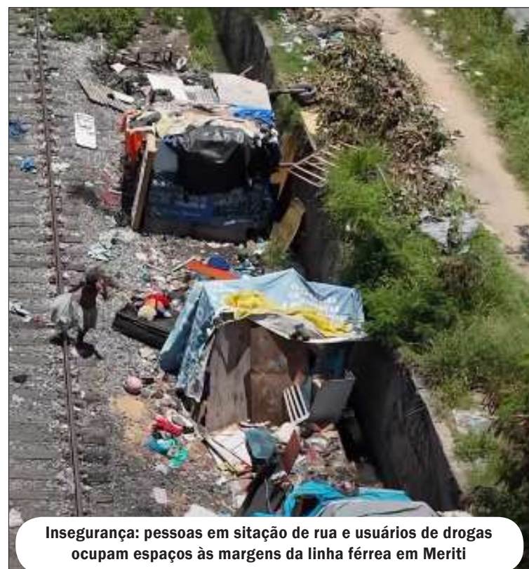
Insegurança: pessoas em situação de rua e usuários de drogas ocupam espaços às margens da linha férrea em Meriti