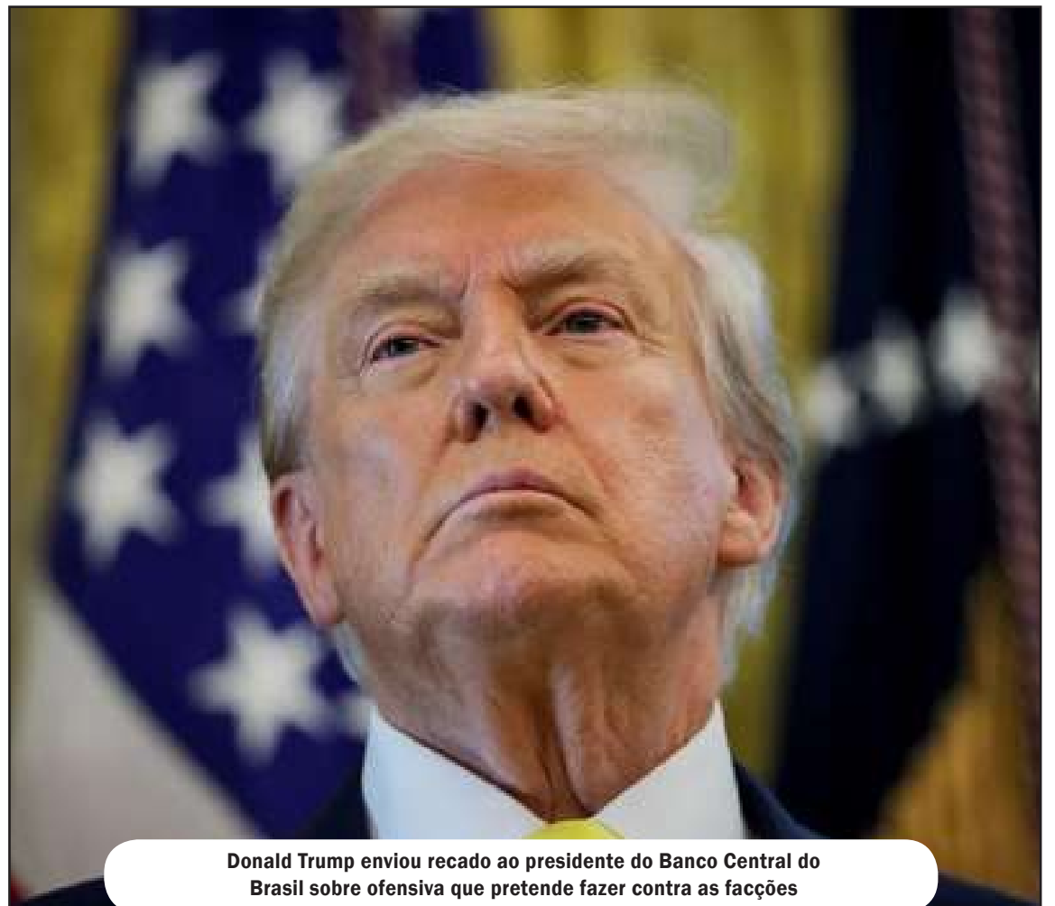
Donald Trump enviou recado ao presidente do Banco Central do Brasil sobre ofensiva que pretende fazer contra as facções

A movimentação, no entanto, ocorre a despeito da resistência da administração do presidente Lula. O governo brasileiro e o Ministério da Justiça defendem que o crime organizado deve ser combatido por meio do intercâmbio de inteligência e forças de segurança, evitando que o tema seja elevado ao patamar de ameaça à segurança nacional sob a ótica externa. Há um receio latente no Palácio do Planalto de que essa classificação abra precedentes para