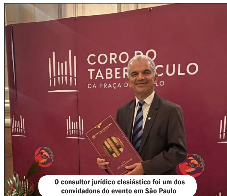
O consultor jurídico clesiástico foi um dos convidados do evento em São Paulo

A BYU é ligada a Igreja de Jesus Cristo dos Santos dos Últimos Dias. O encontro teve como ênfase: A Religião, Democracia e Sociedade Civil, contando com 70 palestrantes, representando mais de 60 países. (Excerptos: Church News). https://www.instagram.com/p/DW5OEQwjTs/?img_index=1 - @prof.gilbertogarcia