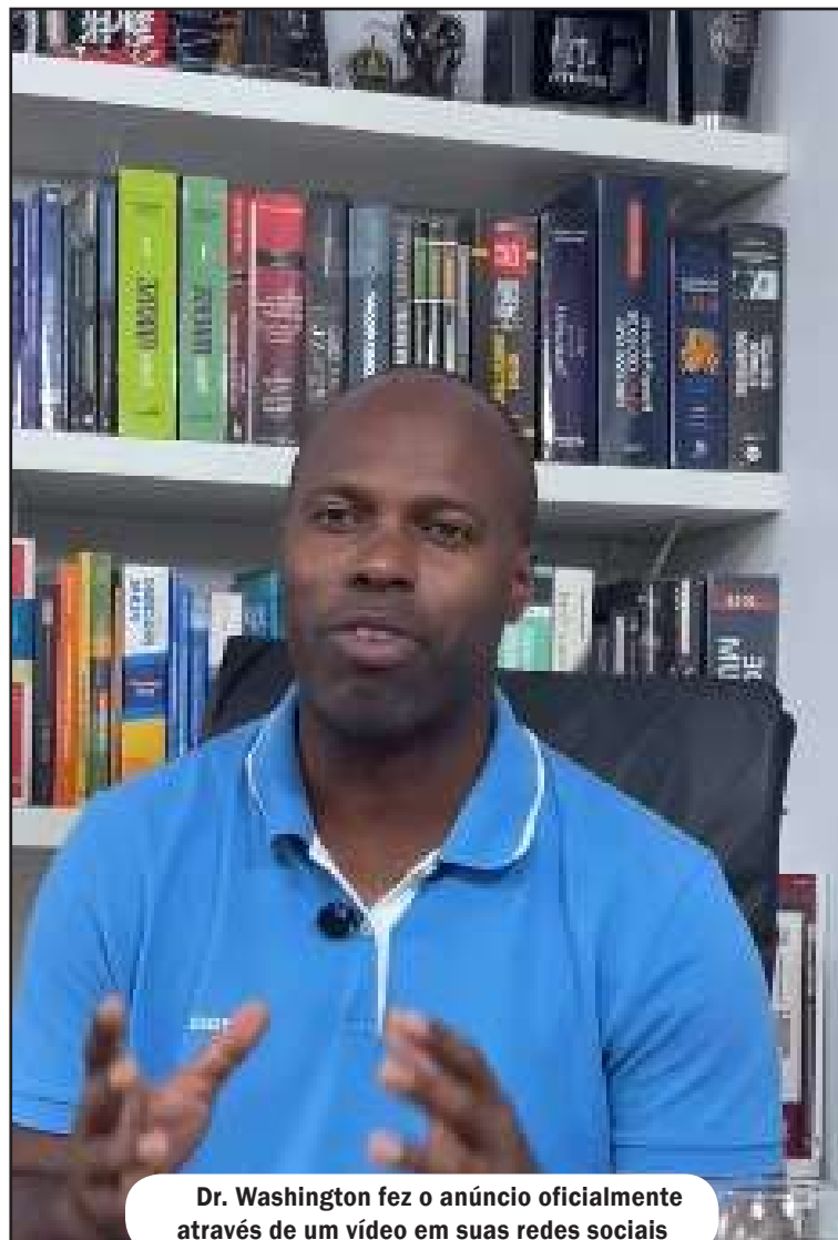
Dr. Washington fez o anúncio oficialmente através de um vídeo em suas redes sociais