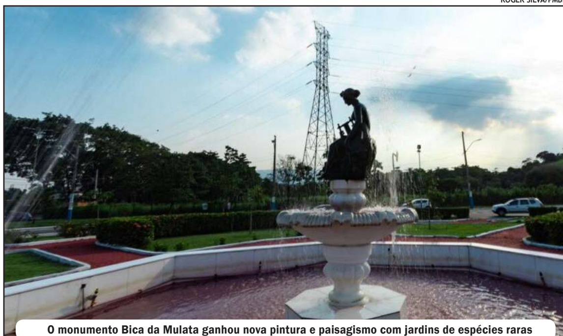
O monumento Bica da Mulata ganhou nova pintura e paisagismo com jardins de espécies raras

por esse modelo de mobiliário urbano não era meramente decorativa; refletia o desejo de modernizar as cidades brasileiras com o que havia de mais