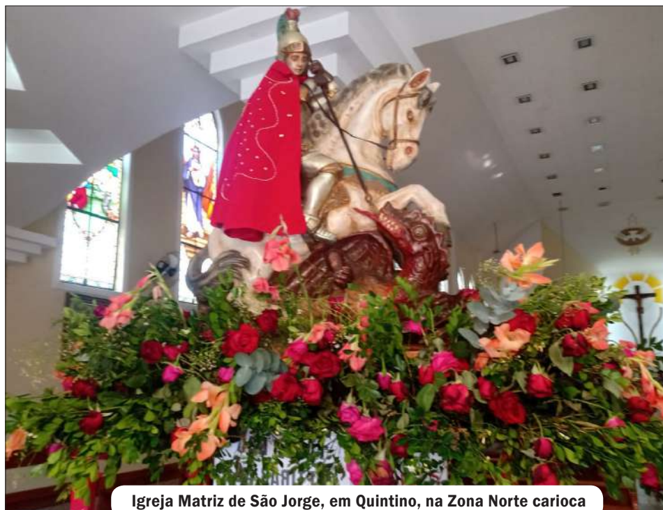
Igreja Matriz de São Jorge, em Quintino, na Zona Norte carioca

Com mais de 1,5 milhão de devotos nas ruas, celebração histórica une a fé profunda do subúrbio à tecnologia inédita, transformando a Paróquia de São Jorge no epicentro da esperança carioca