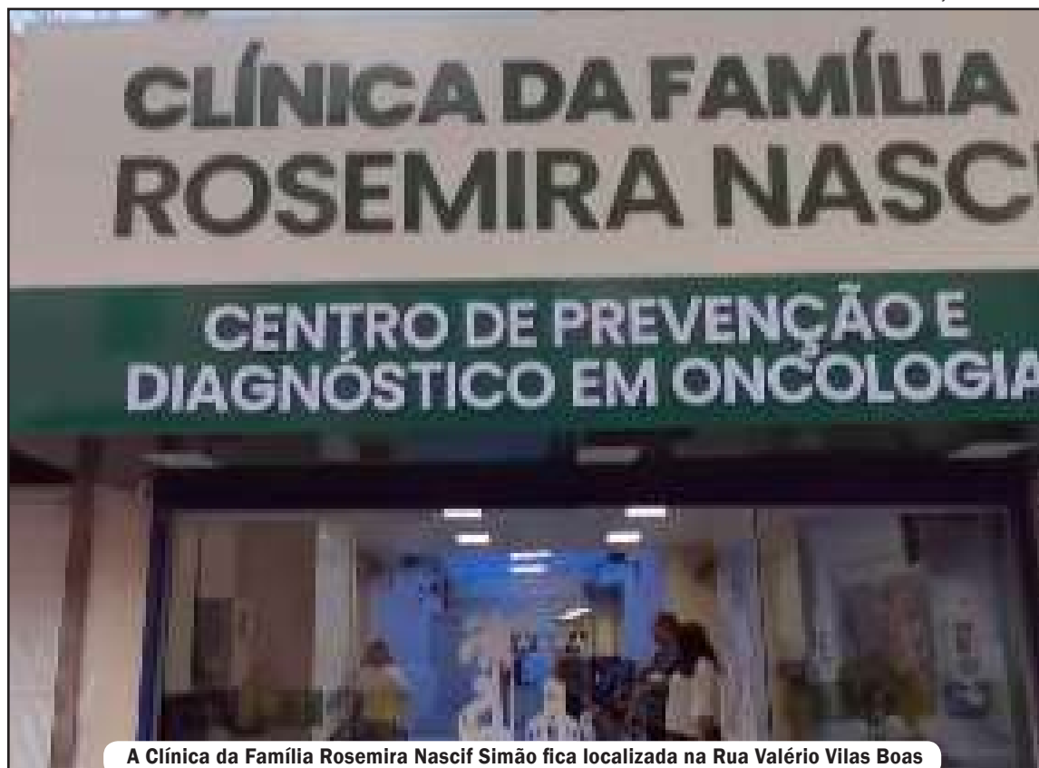
A Clínica da Família Rosemira Nascif Simão fica localizada na Rua Valério Vilas Boas

A Prefeitura de São João de Meriti deu um passo importante na modernização da rede municipal de saúde com a inauguração da Clínica da Família Rosemira Nascif Simão, realizada na tarde de 17 de abril. Localizada estrategicamente no Centro, na Rua Valério Vilas Boas, a unidade chega para transformar o atendimento na região, oferecendo três equipes completas de Saúde da Família e um time especializado em saúde bucal. O