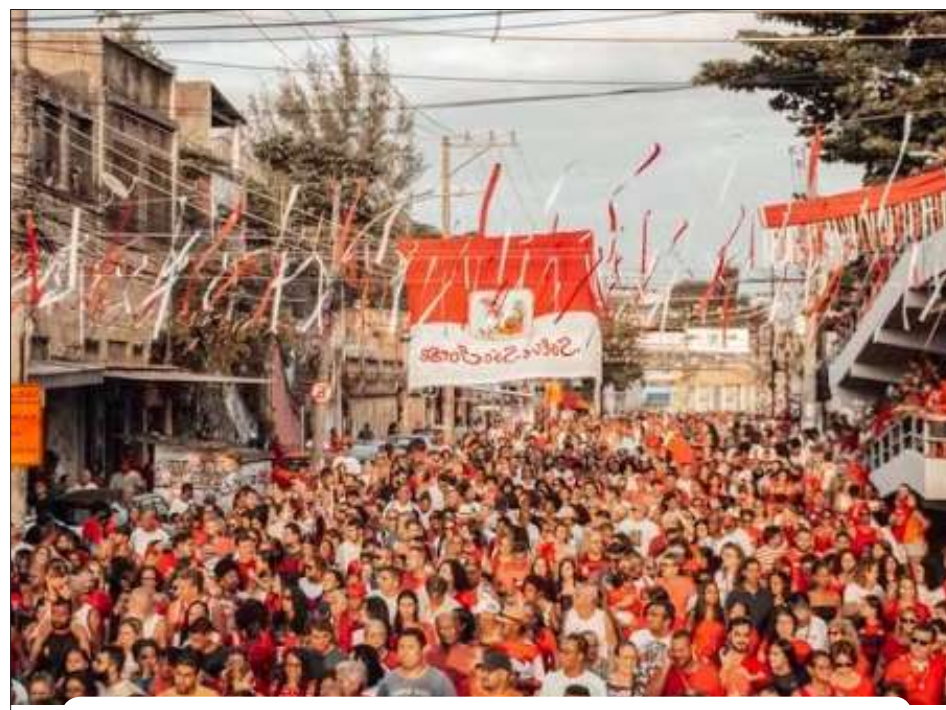
Multidão de devotos lotam o entorno da Igreja Matriz de São Jorge, em Quintino