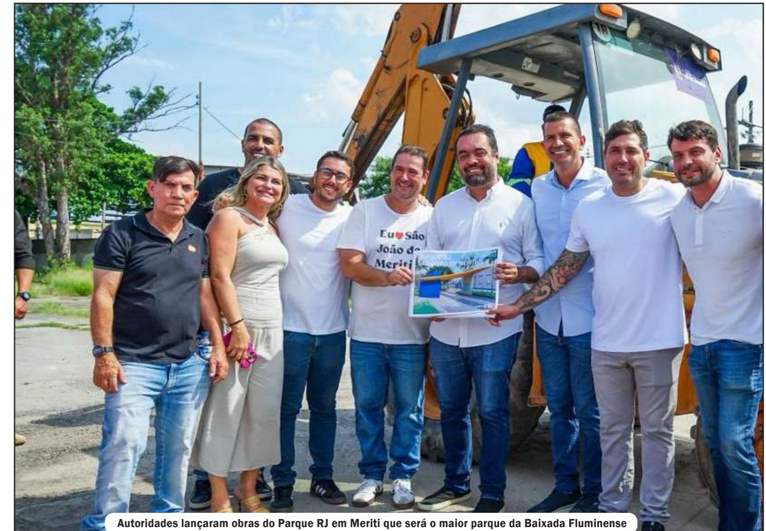
Autoridades lançaram obras do Parque RJ em Meriti que será o maior parque da Baixada Fluminense

Além das áreas de lazer, o projeto também contempla equipamentos públicos importantes, como a construção de uma creche e de um