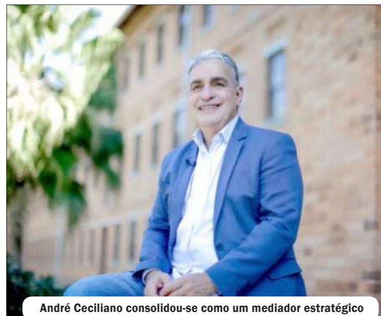
André Ceciliano consolidou-se como um mediador estratégico

Atualmente, André Ceciliano pleiteia o cargo de governador interino do Rio de Janeiro em eleição realizada pelos deputados estaduais. Visto pela base aliada como um nome de confiança e estabilidade, sua proposta foca na continuidade de serviços públicos essenciais e na execução de obras vitais. O mandato temporário representa, acima de tudo, um teste de governabilidade e uma vitrine