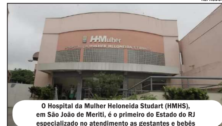
O Hospital da Mulher Heloneida Studart (HMHS), em São João de Meriti, é o primeiro do Estado do RJ especializado no atendimento as gestantes e bebês