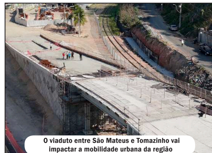
O viaduto entre São Mateus e Tomazinho vai impactar a mobilidade urbana da região

Pensando no caos urbano, o parlamentar propôs o PL 4606/2023, que cria corredores exclusivos para