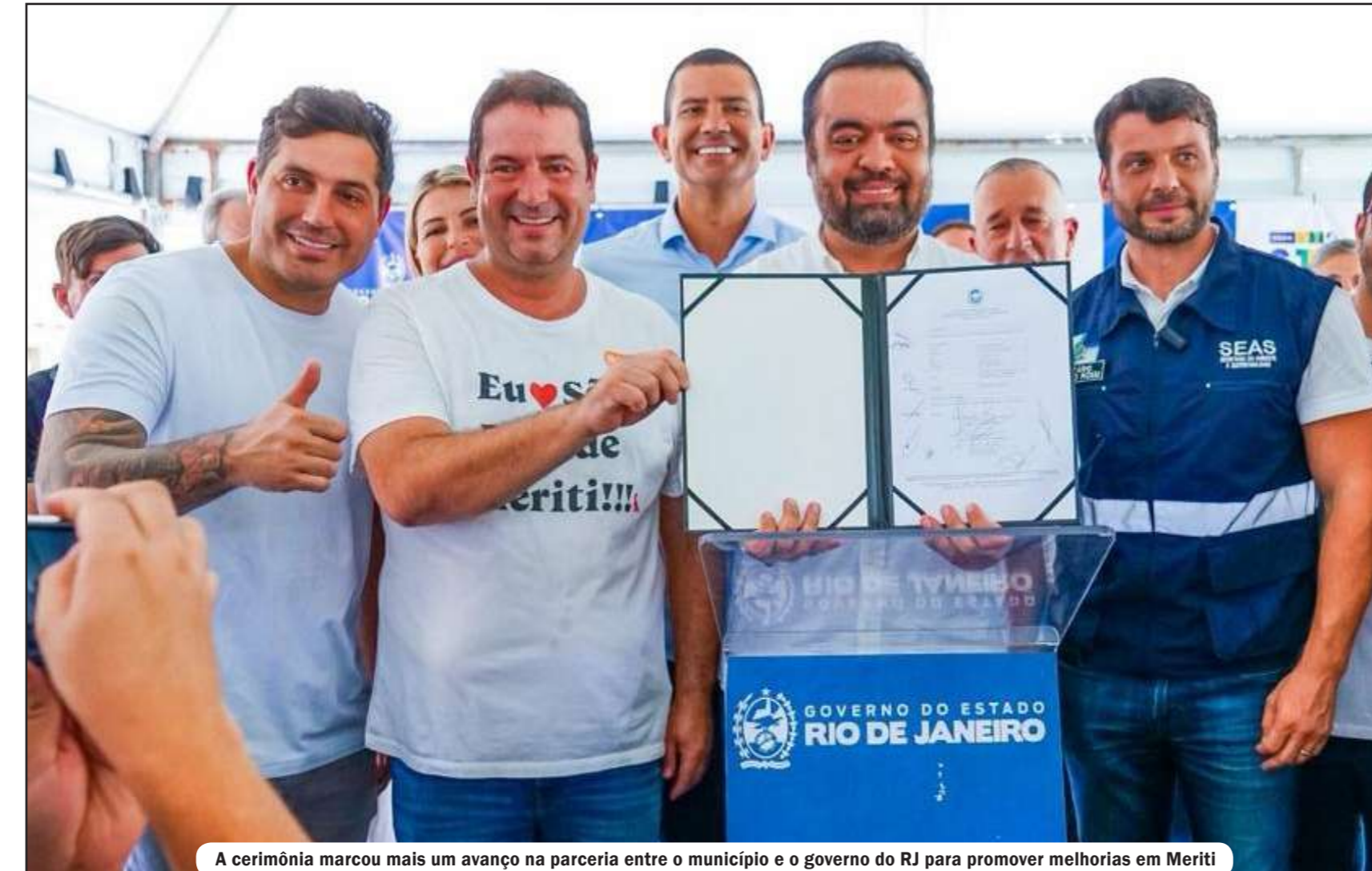
A cerimônia marcou mais um avanço na parceria entre o município e o governo do RJ para promover melhorias em Meriti

As obras de canalização e urbanização do Rio Pavuninha incluem melhorias no sistema de drenagem e a contenção das margens, além da requalificação do entorno com infraestrutura urbana e áreas de convivência. O projeto tem como objetivo melhorar o es-