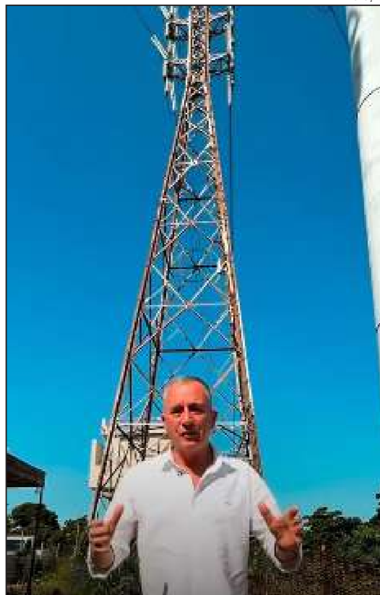
Deputado federal Bebeto e a torre que, segundo ele, trava a obra

Segundo Bebeto, mesmo após reuniões diretas com a presidência da Light e o envio de diversos ofícios reiterando o pedido, a torre permanece no local. Para o deputado, o investimento em mobilidade é urgente para o povo da Baixada, que sofre pontualmente nos horários de pico. “O povo enfrenta engarrafamentos de 2 ou 3 horas por falta de investimento. É inadmissível que uma torre de energia paralise uma obra tão estratégica para o estado”, concluiu.