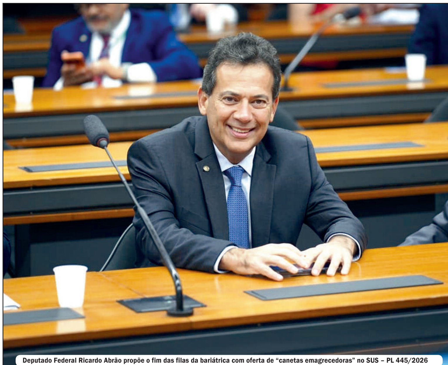
Deputado Federal Ricardo Abrão propõe o fim das filas da bariátrica com oferta de “canetas emagrecedoras” no SUS – PL 445/2026

Atualmente, o sistema público oferece a cirurgia bariátrica para casos selecionados. No entanto, por ser uma intervenção de alta complexidade e com oferta restrita,