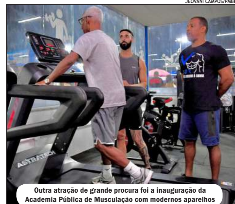
Outra atração de grande procura foi a inauguração da Academia Pública de Musculação com modernos aparelhos

Outra atração de grande procura pelos amantes das atividades físicas foi a inauguração da Academia Pública de Musculação com modernos aparelhos de musculação, esteiras e áreas de convivência,