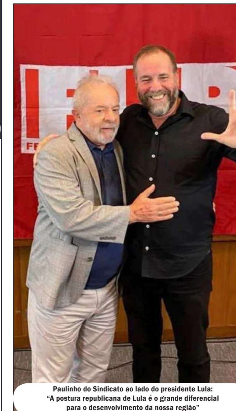
Paulinho do Sindicato ao lado do presidente Lula: “A postura republicana de Lula é o grande diferencial para o desenvolvimento da nossa região”