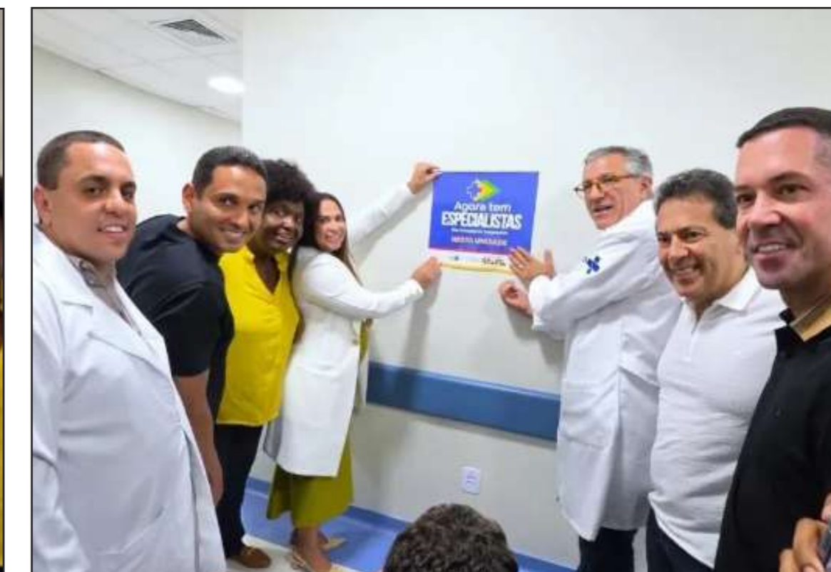
Ao lado de outras autoridades, Alexandre Padilha inaugurou o programa Agora Tem Especialistas no JK

Na tarde do dia 14 de maio, o Hospital Municipal Juscelino Kubitschek recebeu a primeira vistoria técnica do ministro da Saúde, Alexandre Padilha. O evento marcou a estreia do programa Agora Tem Especialistas, incluindo um tour pelas instalações e debates com lideranças regionais.