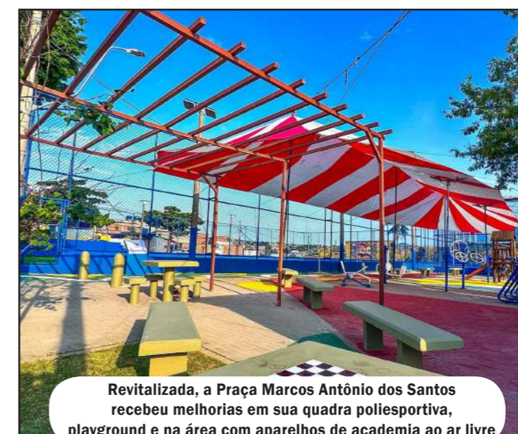
Revitalizada, a Praça Marcos Antônio dos Santos recebeu melhorias em sua quadra poliesportiva, playground e na área com aparelhos de academia ao ar livre