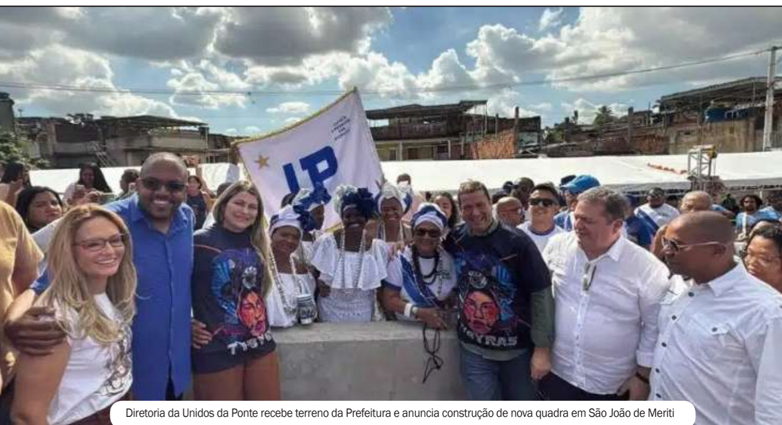
Diretoria da Unidos da Ponte recebe terreno da Prefeitura e anuncia construção de nova quadra em São João de Meriti