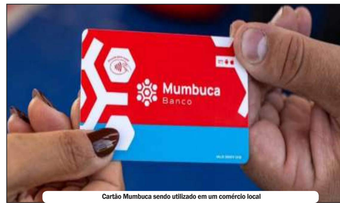
Cartão Mumbuca sendo utilizado em um comércio local

Criada em 2013 para combater a desigualdade, a primeira moeda social do país movimenta o comércio de Maricá e serve de modelo para o mundo