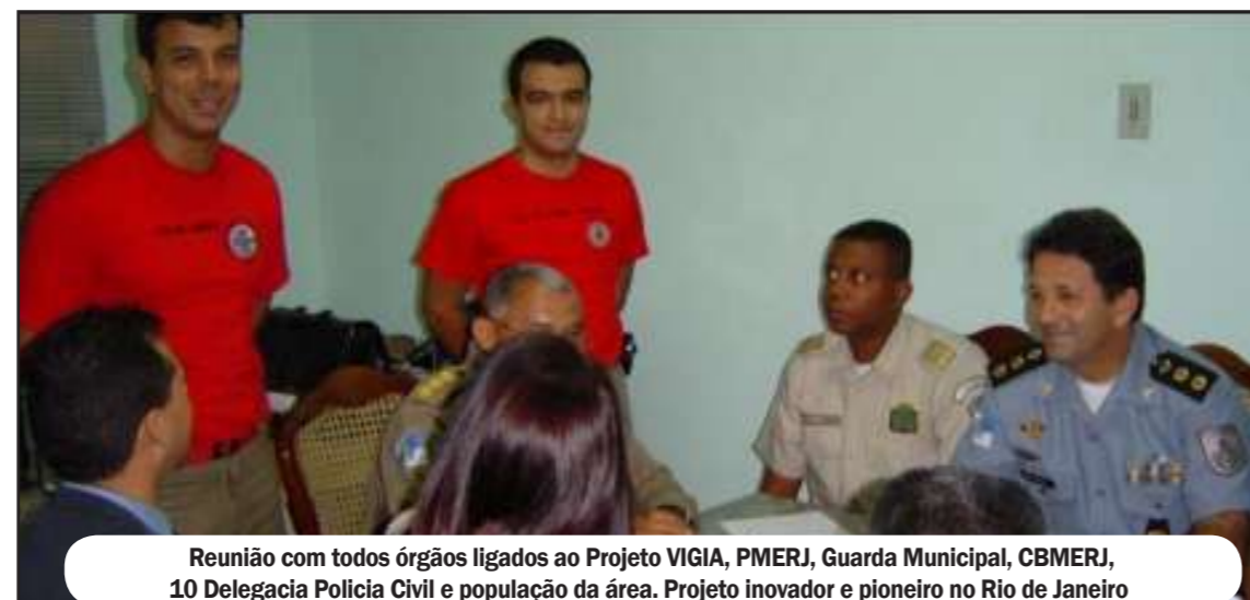
Reunião com todos os órgãos ligados ao Projeto VIGIA, PMERJ, Guarda Municipal, CBMERJ, 10 Delegacia Polícia Civil e população da área. Projeto inovador e pioneiro no Rio de Janeiro