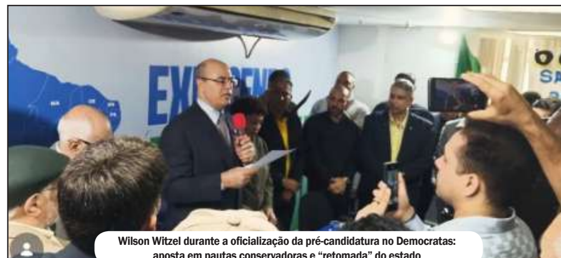
Wilson Witzel durante a oficialização da pré-candidatura no Democratas: aposta em pautas conservadoras e “retomada” do estado

Mesmo após impeachment, ex-governador lança pré-candidatura e desafia rivais de olho no Palácio Guanabara com propostas para segurança pública com tolerância zero ao crime