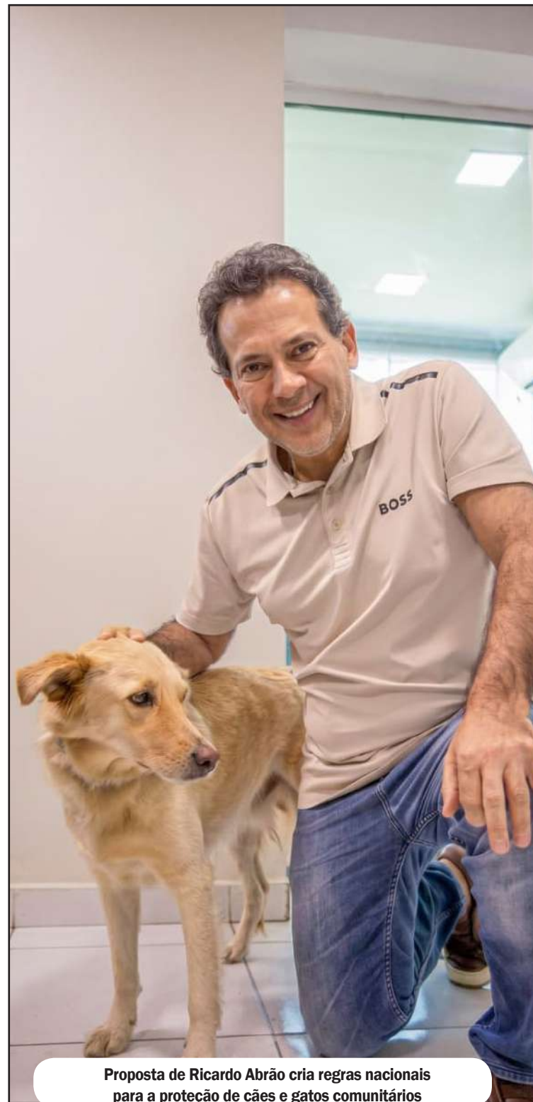
Proposta de Ricardo Abrão cria regras nacionais para a proteção de cães e gatos comunitários

“Nosso objetivo é acabar com situações em que pessoas solidárias são penalizadas simplesmente por ajudar um animal abandonado. Precisamos de regras claras, que