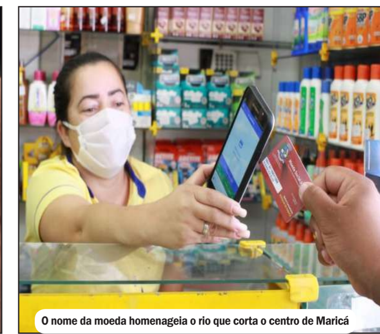
O nome da moeda homenageia o rio que corta o centro de Maricá